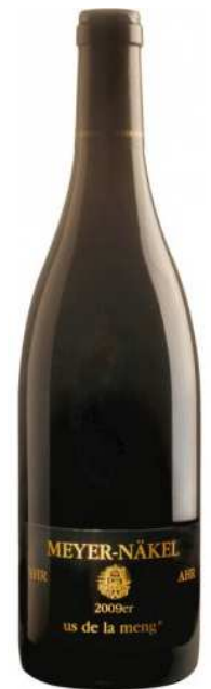
Weinbaugebiet DEUTSCHLAND Ahr

Schonende Verarbeitung, ausgebaut im großen Holzfass bei einer Lagerungszeit von ca. 6 Monaten. Die Cuvée für diesen Rotwein stellen wir durch probieren zu einem harmonischen, fruchtigen Rotwein mit runden Tanninen zusammen. In der Nase als auch am Gaumen dominieren Pflaume, Heidelbeere und Brombeere in Kombination mit Gewürzen wie Nelke, Zimt und Lorbeer mit einem Hauch Zartbitterschokolade.